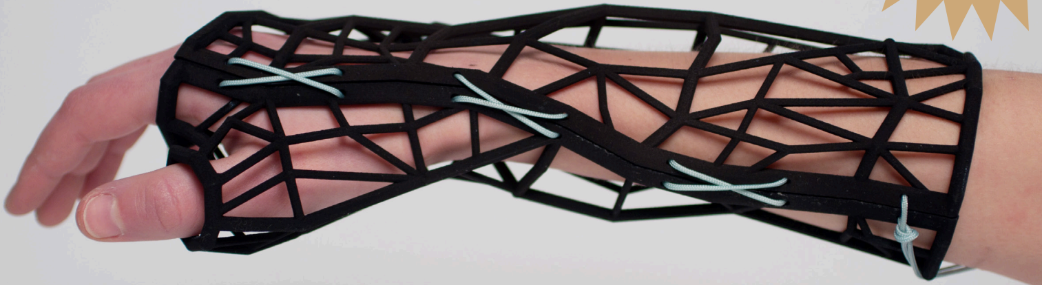
EDGES, NEW GENERATION PROTHESIS | M. Cavalleri S.V. Richiuso

E' aperto il nuovo contest MAKE to CARE che ha l'obiettivo di far emergere e sostenere iniziative e progetti nati dall'ingegno e dalla passione di maker e innovatori, capaci con le loro idee di offrire una migliore qualità di vita a chi affronta ogni giorno una condizione di disabilità , spesso progettando insieme a loro un futuro migliore. E' possibile candidare direttamente il proprio progetto entro il 15 settembre 2017 accedendo alla pagina www.makerfairerome.eu/it/call-for-makers/